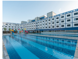
PRAIA GRANDE 1