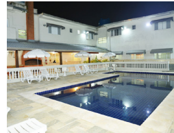
PRAIA GRANDE 2